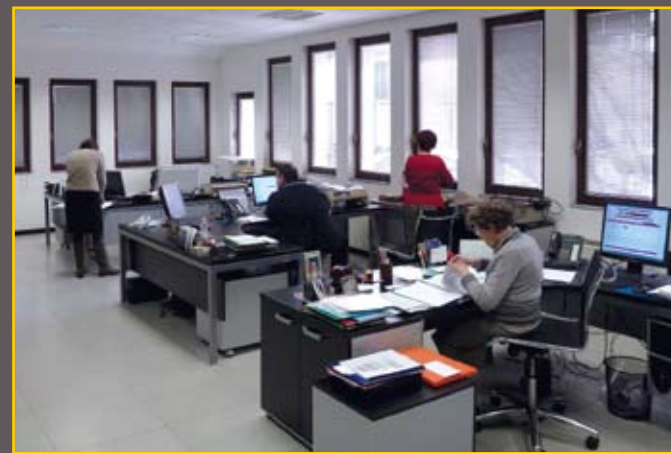
Sede di Turbigo / Headquarters Turbigo