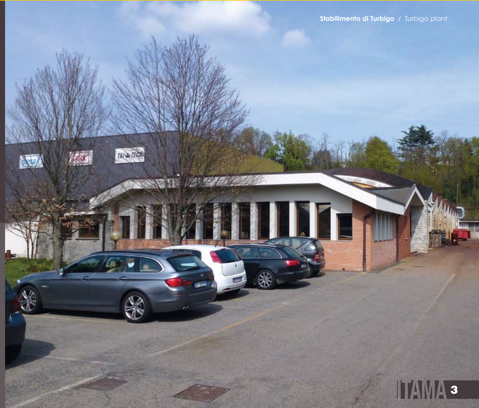
Stabilimento di Turbigo / Turbigo plant

A great reality in the universe of machine tools construction: from the beginning ITAMA has always headed for the attainment of a main objective: satisfy the multiple and various requirements in the field of machine tools, not privileging any field in particular but taking into consideration both small activities and cycles of great production. The availability of ITAMA to assist its customers for every technical problem places it like reliable point in the mechanic field. Sales in the world-wide level have had an exponential increase and today ITAMA can count on agents of primary importance in the fields of their competence.