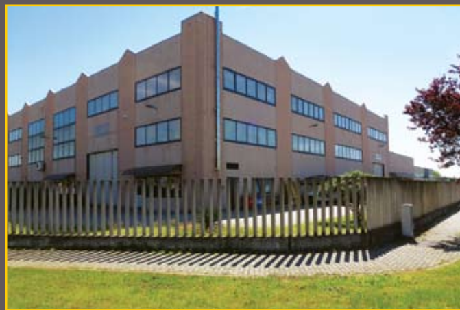
Filiale di Galliate / Galliate Branch